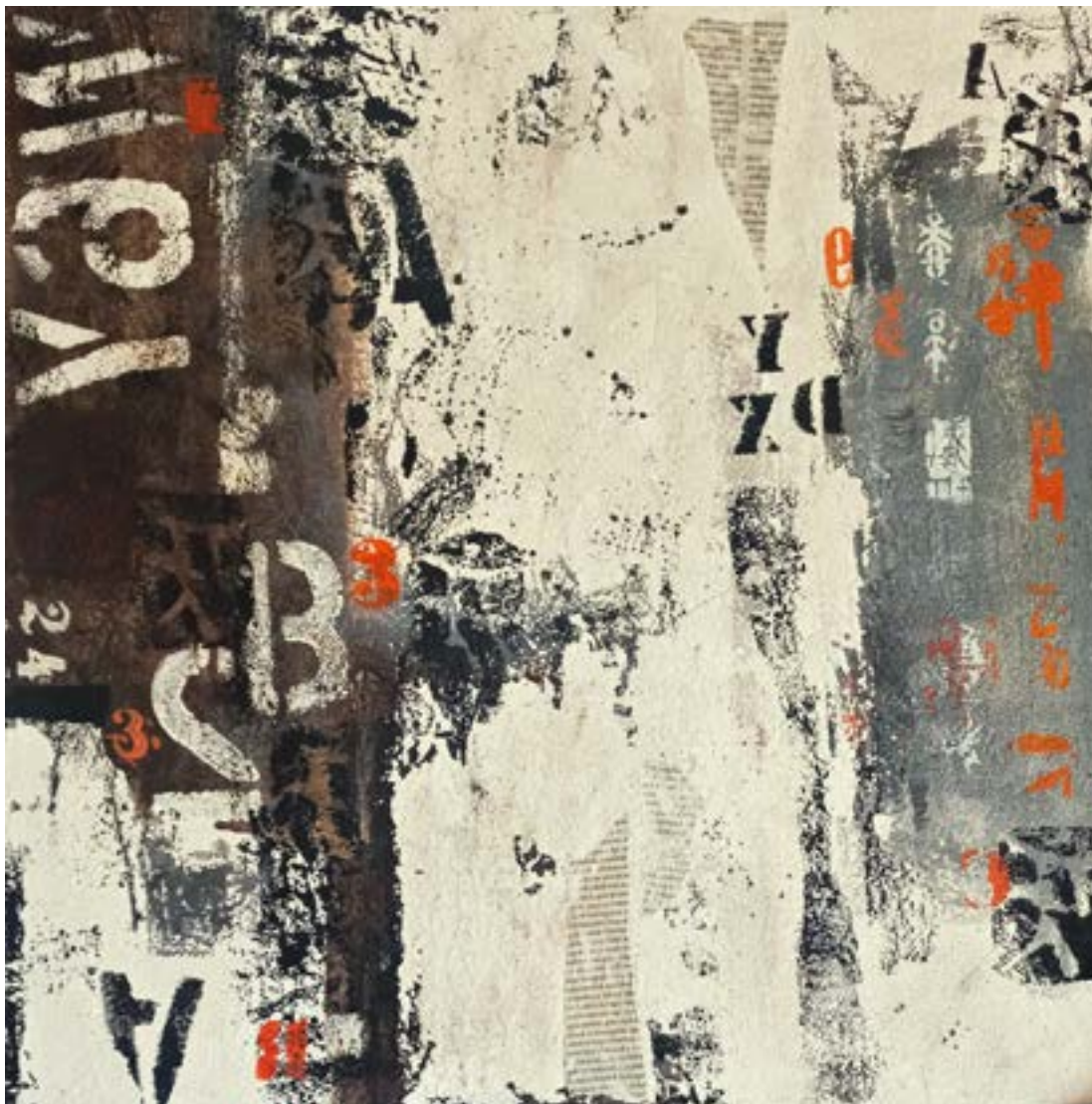
HARD DREAMS akril, vászon, 50 x 50 cm