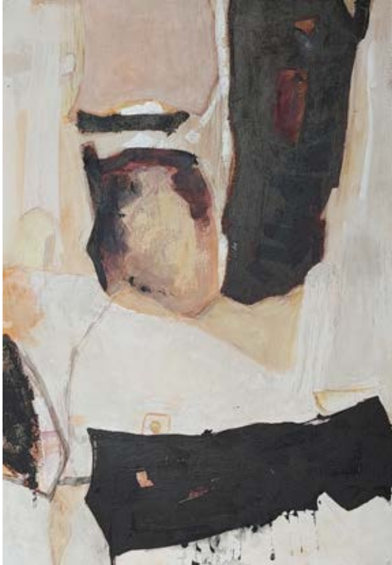
KOMPOZÍCIÓ EMLÉK I. vegyes technika, farost, 100 x 70 cm