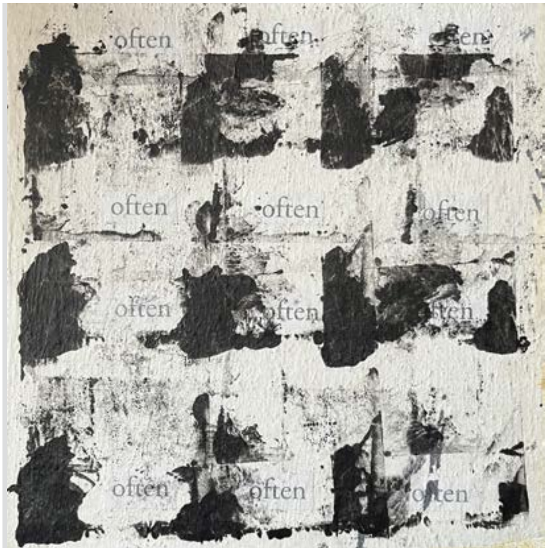
MANTRA vegyes technika, 30 x 30 cm