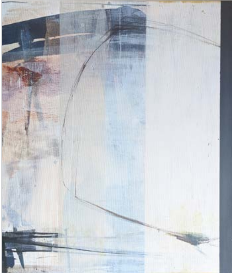
SEBEZHETŐSÉG I. akril, vászon, 80 x 65 cm