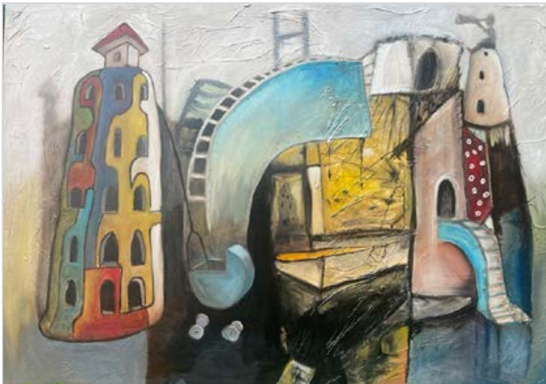
JÁTSZÓTÉR akril, vászon, 70 x 100 cm