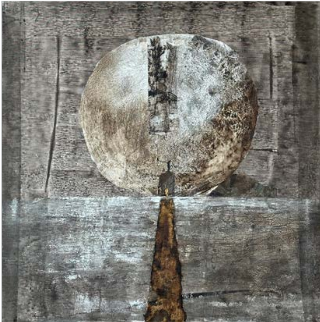
MONOLIT I. akril, vegyes technika, 70 x 70 cm