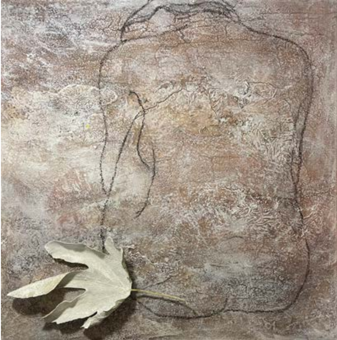
GAIATÓL ELSZAKADVA akril, vegyes technika, vászon, 50 x 50 cm