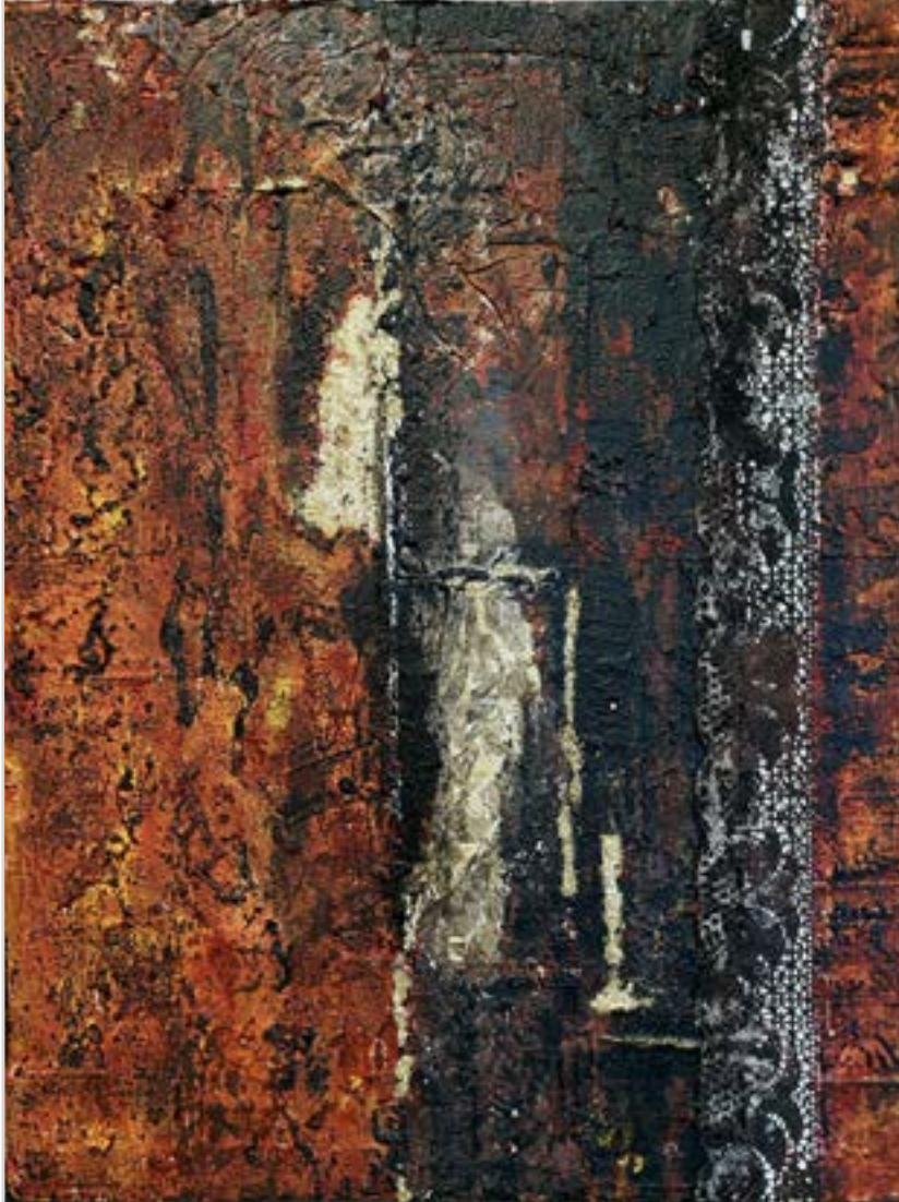
CÍM NÉLKÜL vegyes technika, 50 x 40 cm