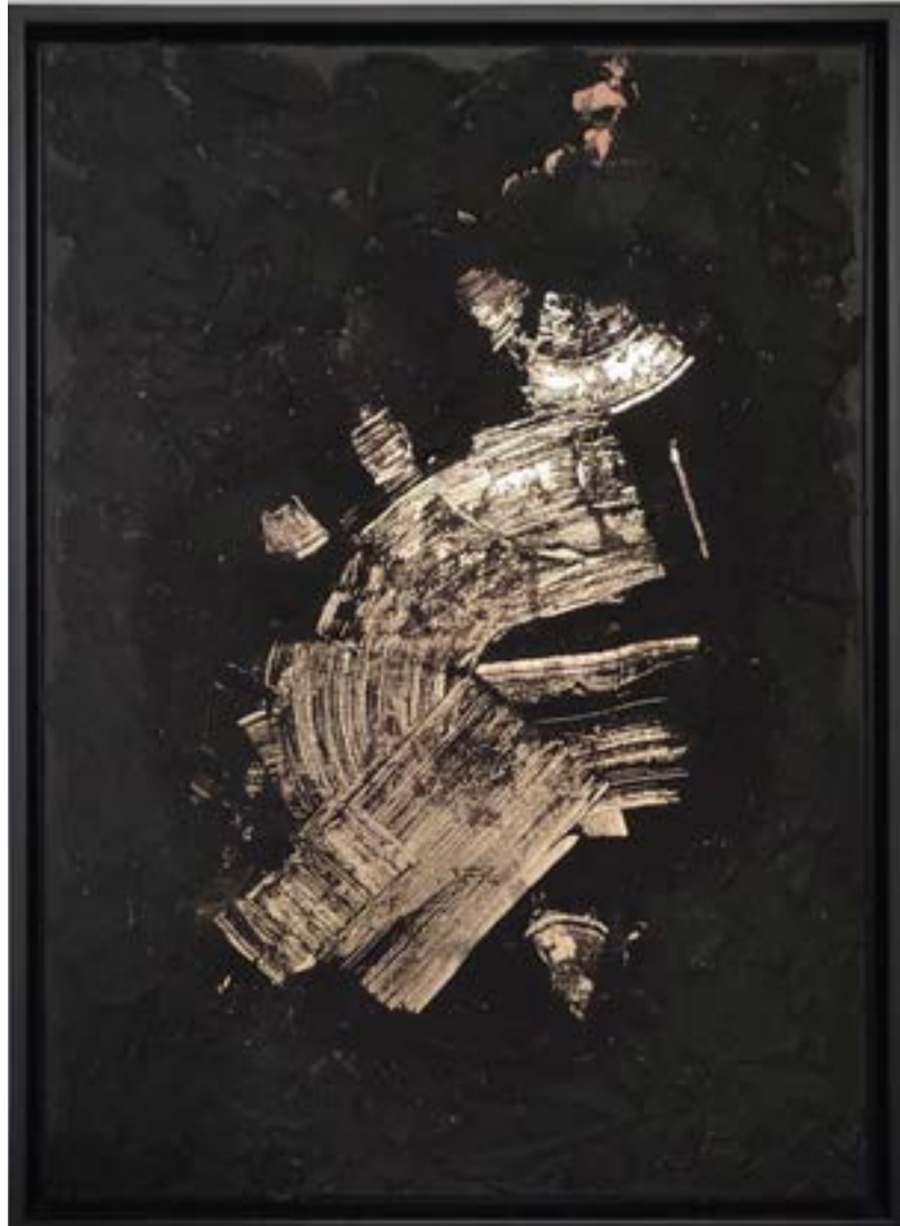
ÉJJELI RAGYOGÁS akril, vászon, vegyes technika, 70 x 50 cm