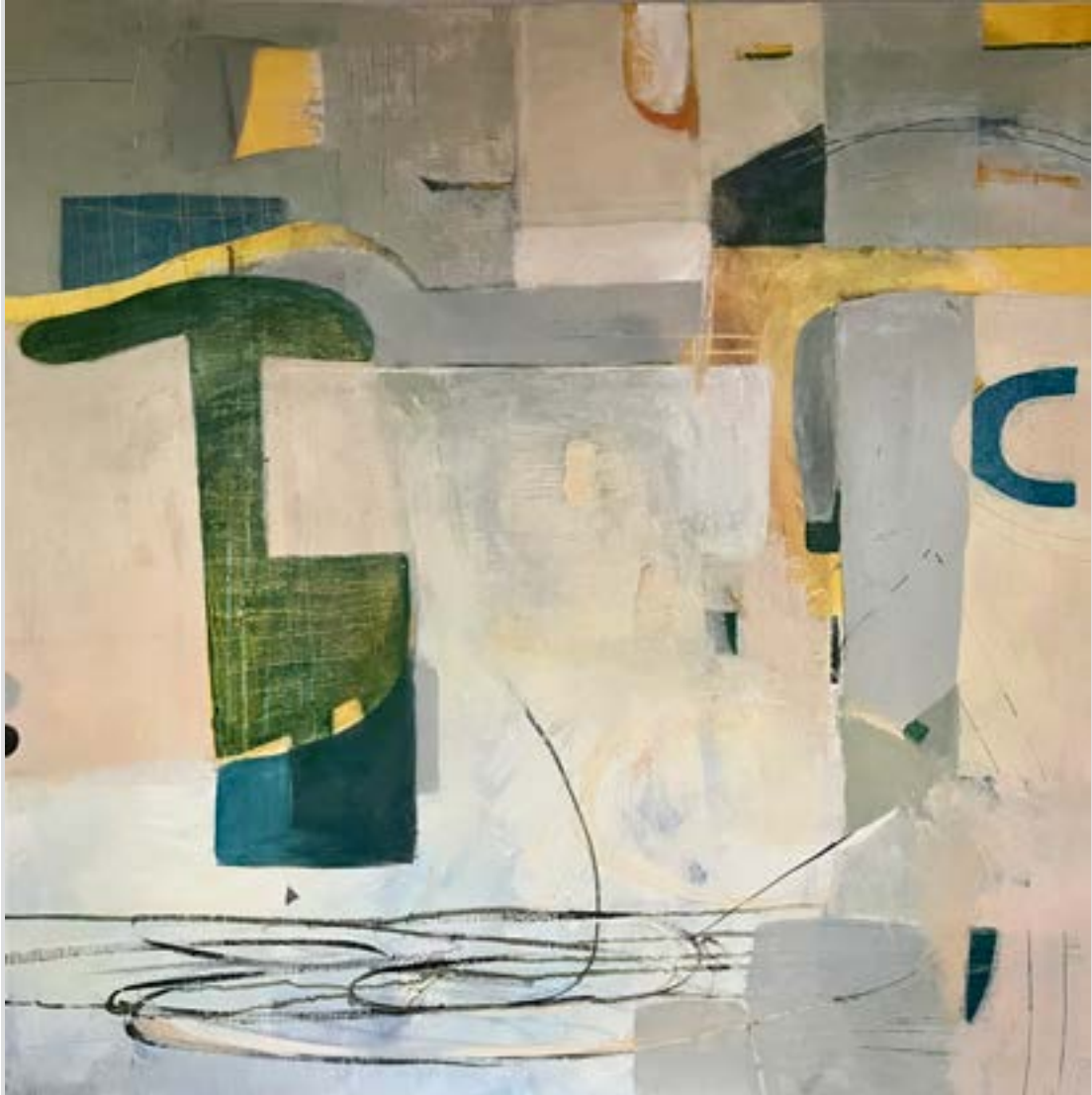
ELÉGEDETSÉG olaj, vászon, 100 x 100 cm