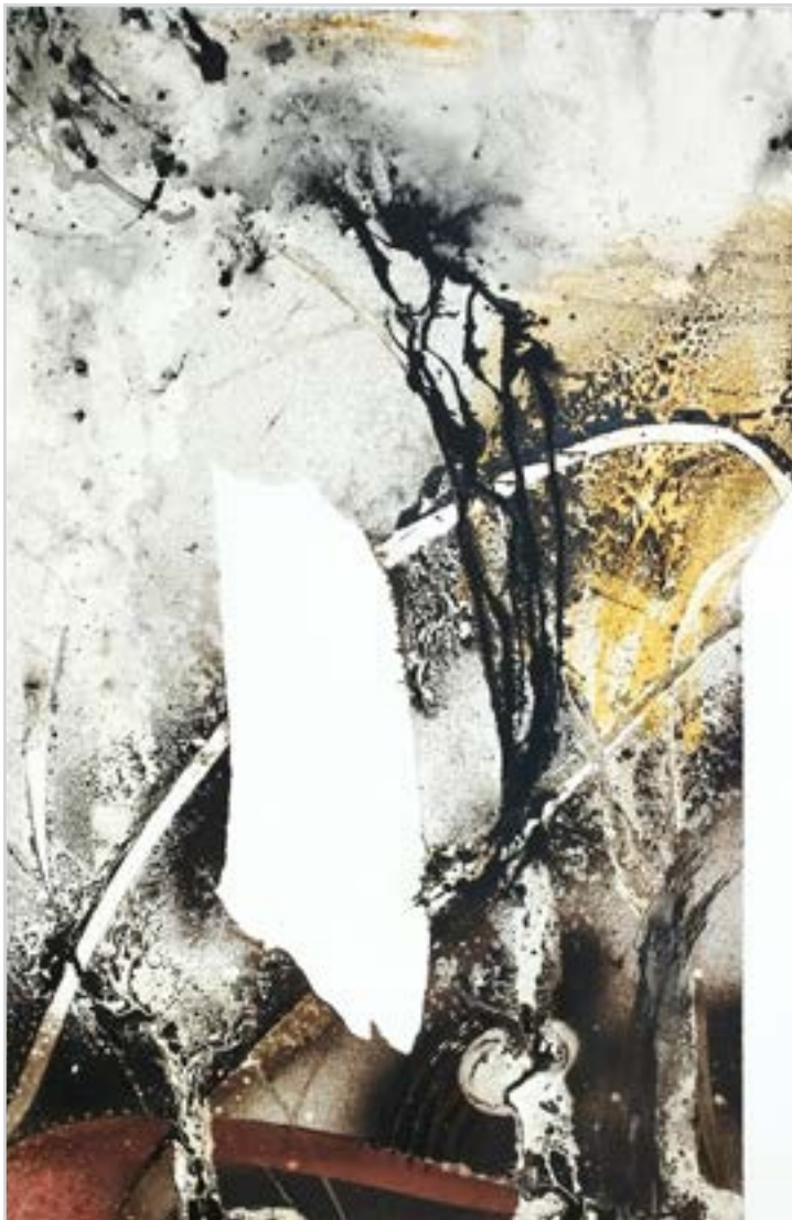
MEDITÁCIÓ akril, vászon, 70 x 50 cm